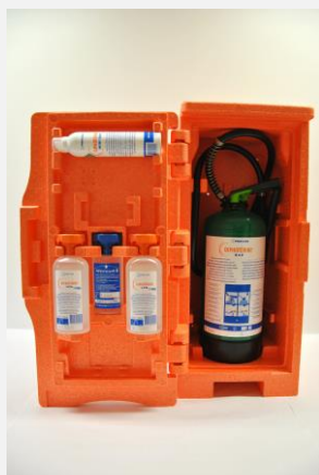
Nástenná stanica PPE - DIPHOTERINE®